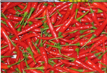
Gemüse, u.a. Chili, Paprika, Bittergurke (Momordica), Basilikum, Mexikanischer Koriander, Okra ...

Viele aus fernen Ländern mitgebrachte Früchte können sogenannte Quarantäneschadorganismen, u.a. Fruchtflyen, enthalten und stellen somit ein hohes Risiko dar.