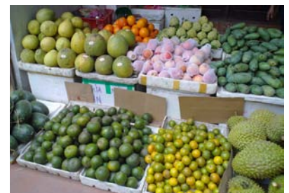
Zur Einfuhr ist ein Pflanzengesundheitszeugnis notwendig.