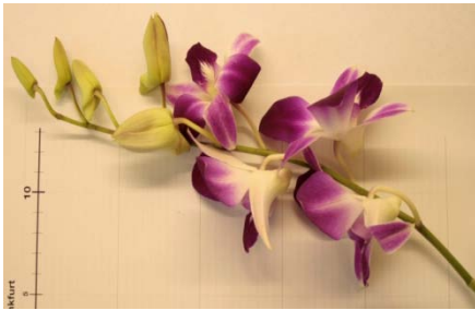
Schnittblumen/Bouquets, z.B. Orchideen, Rosen