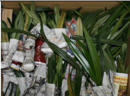
Generell alle Pflanzen*

Ja, aber es wird in jedem Falle, zusätzlich zu einem ggf. auf der Packung angebrachten Behandlungshinweis, ein gültiges Pflanzengesundheitszeugnis (Gültigkeit in der Regel 14 Tage), ausgestellt von der Pflanzengesundheitsbehörde im Ausland verlangt. Gegensätzliche Aussagen, z.B. von Shops in den entsprechenden Ländern, auch an den dortigen Flughäfen, sollten Sie hinsichtlich dieser Belange nicht immer Glauben schenken. Schnittblumen, u.a. Orchideen sind die, bei der Passagierkontrolle am Flughafen Frankfurt, am häufigsten zurückgewiesenen pflanzlichen Waren.