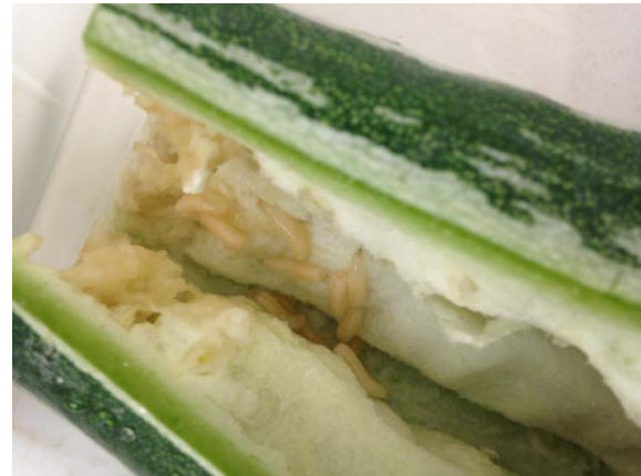
Guten Appetit (Fruchtfliegenlarven in Gurke aus Asien).

Beispielsweise unterliegen alle Pflanzen, welche zum Anpflanzen oder zur Weiterkultur bestimmt sind, genauso wie bestimmte Schnittblumen (z.B. Orchideen, Rosen) oder Früchte (z.B. Mango, Zitrus, Chili), den besonderen EU-Einfuhrbestimmungen oder sind sogar gänzlich Einfuhrverboten (wie z.B. Kartoffeln oder Erde).