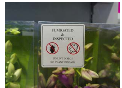
Dieser Hinweis reicht alleine zur Einfuhr nicht aus.

Kontaktadresse beim hessischen Pflanzenschutzdienst: Email: planthealth@rpgi.hessen.de