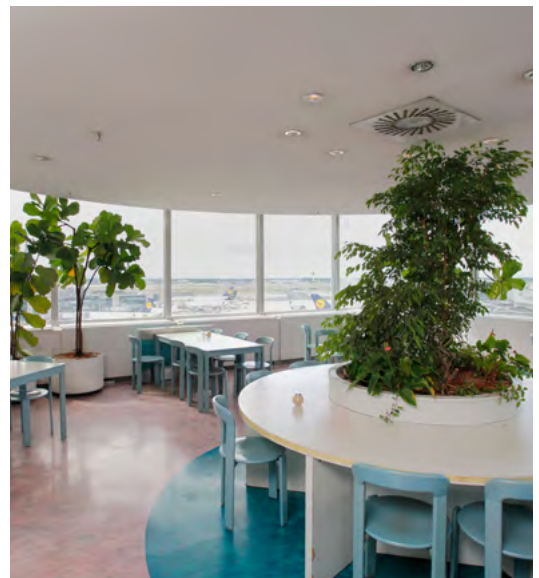
Kantine in der Ebene 07