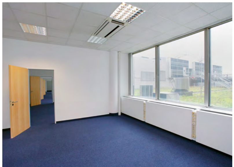
Beispiel für ein Büro