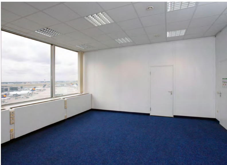
Beispiel für ein Büro