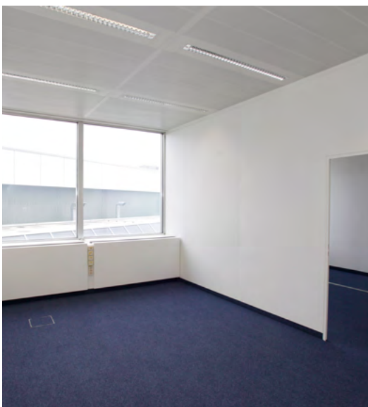
Beispiel für ein Einzelbüro